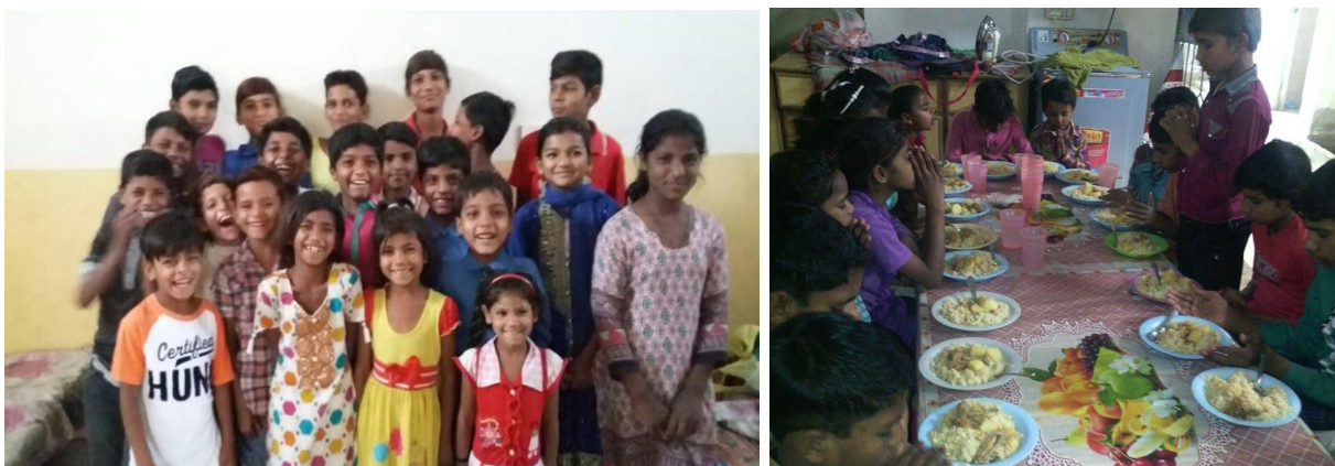
Afbeelding 3.5: Kinderen van het Hostel

Daarom heeft PECA, tijdens de reis in februari 2016, 27 kinderen opgenomen en voorziet hen in onderdak, levensonderhoud, onderwijs en geestelijke ondersteuning. Zij staan onder begeleiding van een verzorger die dagelijks bij hen is. Overdag gaan de kinderen naar de school van TSW. Verder biedt PECA de kinderen levensonderhoud door middel van voedsel, verzorgingsmiddelen (zeep, tandpasta, etc.) en kleding.