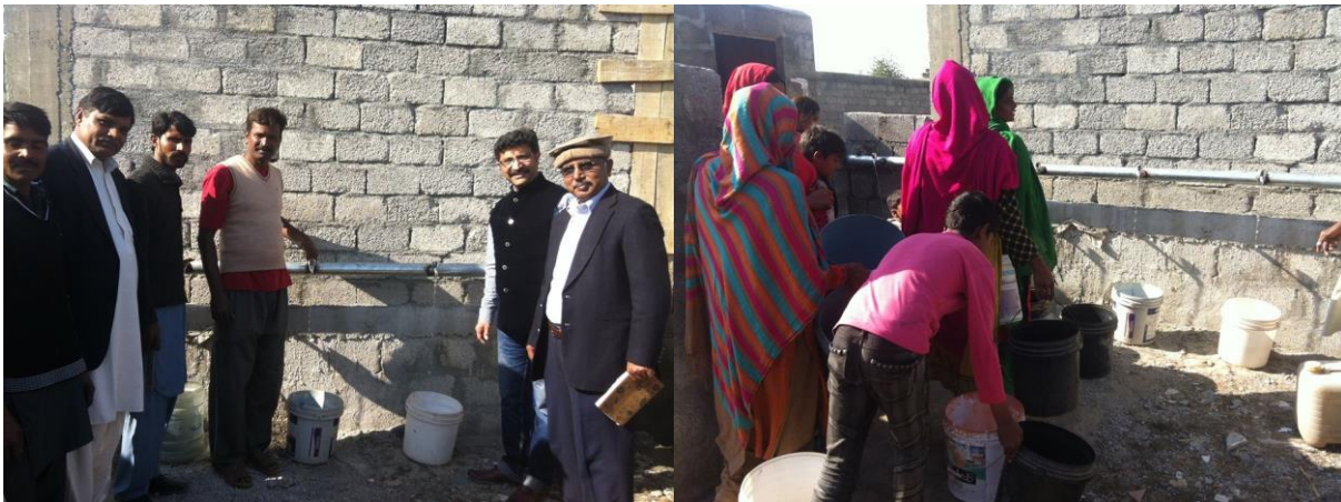
Afbeelding 3.2: Waterpomp in H9

Het meisje werd vrijgesproken en is gevlucht, maar de mensen uit haar wijk waren niet meer veilig en zijn zo snel mogelijk gevlucht naar de sloppenwijk H9. In H9 hebben deze mensen geen voorzieningen zoals onderwijs, elektriciteit en schoon drinkwater. Het vervuilde drinkwater is het grootste probleem in H9. Mensen moesten lang reizen om schoon drinkwater te halen. Niet alle mensen hebben geld om naar andere wijken te gaan om water te halen, hierdoor waren mensen genoodzaakt om het vervuilde water te gebruiken waar zij vervolgens heel ziek van werden. Met behulp van een gift van SDOK heeft PECA Samen met TSW een waterpomp geplaatst in H9. Dankzij de waterpomp hoeven de mensen niet meer te reizen om schoon drinkwater te halen in andere wijken.