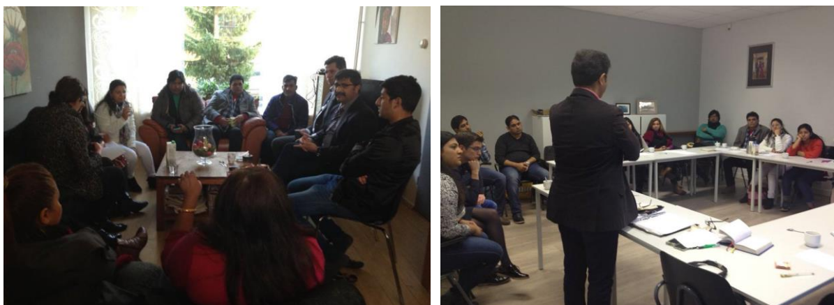
Afbeelding 3.13: Bijeenkomst met asielzoekers in Nederland

In 2016 heeft PECA meerdere asielzoekers geholpen met de voorbereidingen van hun eerste interview of bij een tweede asielaanvraag. Daarnaast heeft PECA ook enkele uitgeprocedeerde asielzoekers opgevangen totdat zij weer terug konden naar het AZC of ergens anders konden verblijven. PECA heeft meerdere bijeenkomsten georganiseerd met christelijke asielzoekers om te praten over hun problemen en de uitdagingen waar zij mee te maken krijgen.