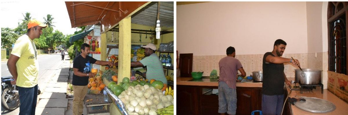
Afbeelding 3.8: Inkopen doen op de markt en maaltijdbereiding in de PECA-huizen

PECA streeft ernaar dat geen enkele gevluchte Pakistaanse christen in Sri Lanka een tekort heeft aan voedsel en dat iedereen onderdak heeft. Alle bewoners van de PECA-huizen krijgen twee maaltijden per dag. 's Ochtends tussen 8.00 en 10.00 uur krijgen de mensen hun ontbijt. Daarna krijgt iedereen om 17.00 uur een warme maaltijd. Aangezien de mensen maar twee maaltijden per dag krijgen, streven wij ernaar om ze een gezonde en gevarieerde maaltijd te bieden. Elke week gaan een paar mensen van het managementteam naar de markt om het voedsel in te kopen. Het voedsel wordt door de teamleiders van elk huis verdeeld over de twee huizen. Het is de taak van de kok om een week lang op een juiste manier gebruik te maken van deze producten (zie afbeelding 4.1).