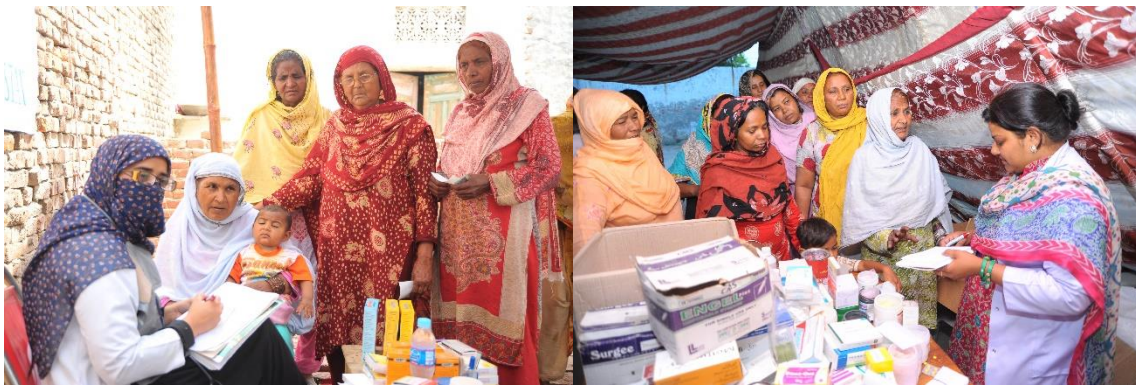
Afbeelding 3.6: Medische kampen