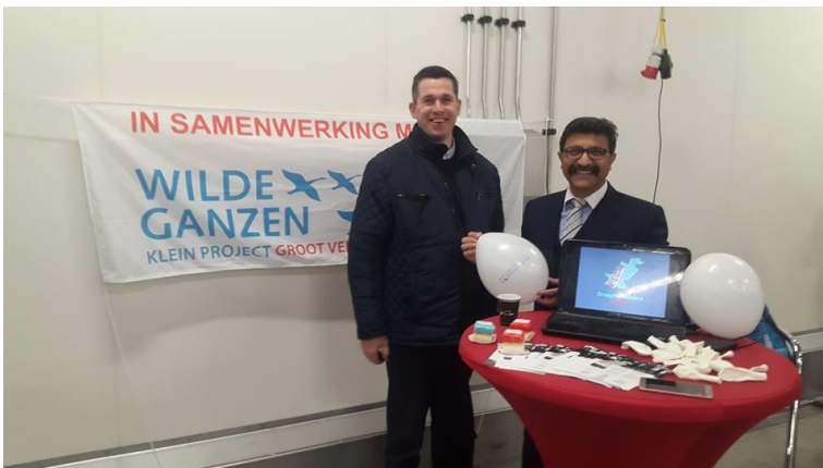
Afbeelding 4.2: Opening van DaySeaDay op Urk

Zaterdag 17 december 2016 heeft PECA een kraampje opgezet op de openingsdag van de nieuw uitbreiding van DaySeaDay op Urk. Het kraampje was bedoeld om meer bekendheid te aan de situatie van arbeiders van de steenbakkerij in Pakistan en om aandacht te vragen voor het werk van PECA.