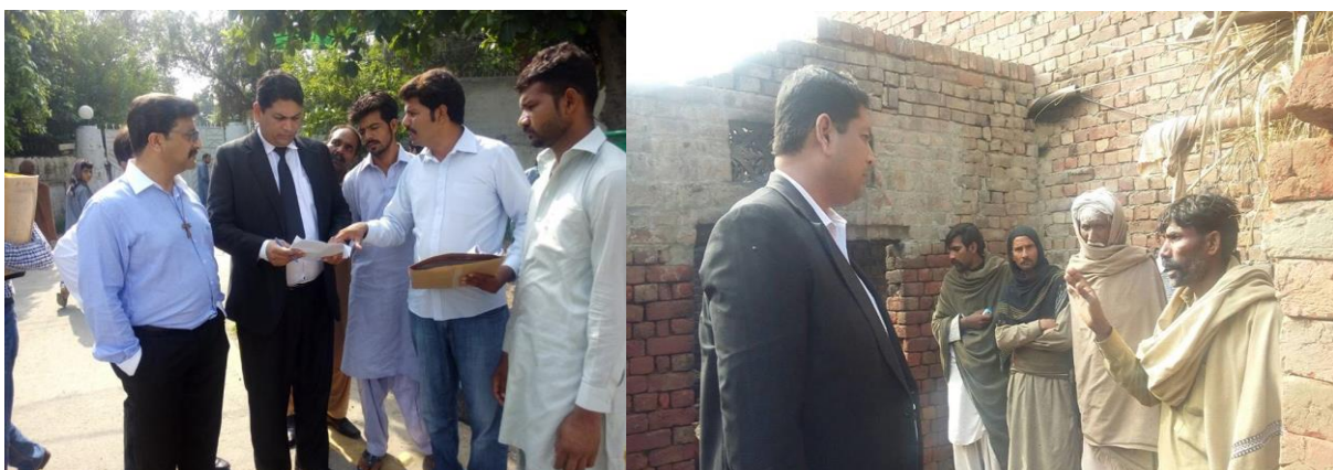
Afbeelding 3.1: Juridische team van PECA