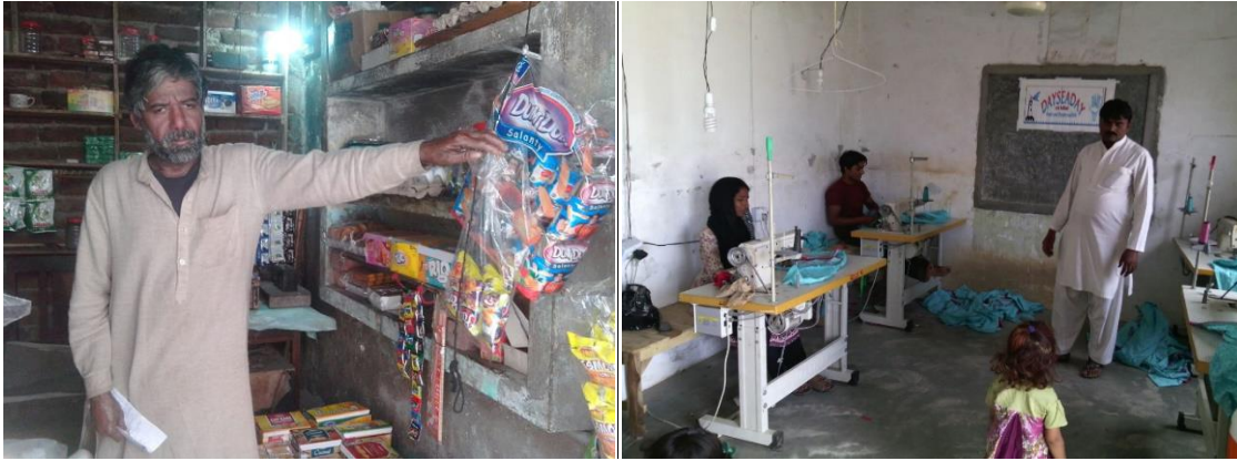
Afbeelding 3.4: Naaiatelier en kruidenierswinkel van vrijgekochte arbeiders

Sommige arbeiders van de steenbakkerij hebben hele hoge schulden. PECA kon niet iedereen helpen, maar de mensen waren heel wanhopig. Toen de mensen hoorden dat PECA bezig is met het vrijkopen van arbeiders hebben veel mensen PECA's team benaderd. PECA heeft die mensen uitgelegd dat wij hen niet kunnen helpen vanwege beperkte financiën. Veel ouders hebben PECA gesmeekt om hun kinderen dan te helpen en mee te nemen en voor hen te zorgen. De kinderen mochten namelijk sinds februari 2016 ook niet meer in de buurt van de steenfabrieken komen omdat de overheid dat verboden heeft, maar als beide ouders werken en de kinderen niet naar school kunnen zijn de kinderen dus alleen en is er voor hen ook geen andere toekomst dan een leven lang werken in de steenfabriek.