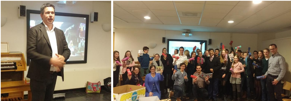
Afbeelding 4.1: lezing op de jeugdvereniging in Nunspeet

Twee april 2016 heeft PECA een lezing gegeven op de jeugdvereniging van de Gereformeerde gemeente in Nunspeet. De lezing ging over de kinderen van de steenbakkerij. De jongeren van de vereniging hadden schriftjes, pennen, etuis, tandpasta en tandenborstels verzameld voor de kinderen van het Hostel in Pakistan.